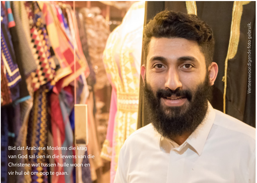
Verteenwoordigende foto gebruik.

Bid dat Arabiese Moslems die krag van God sal sien in die lewens van die Christene wat tussen hulle woon en vir hul oë om oop te gaan.