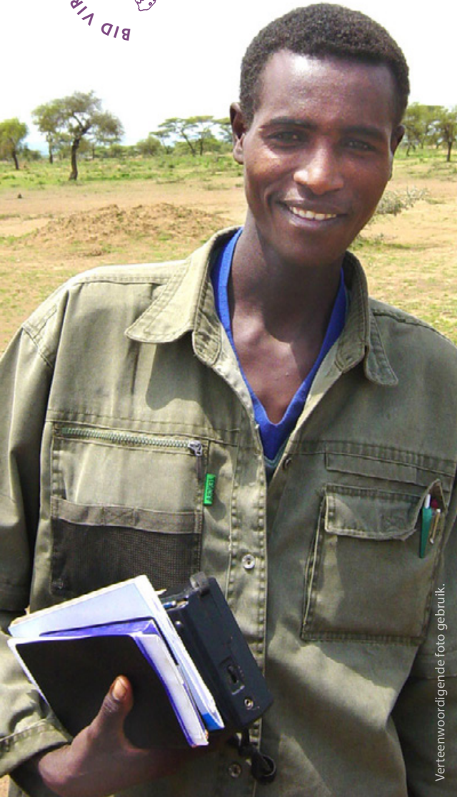
Verteenwoordigende foto gebruik.

Ons het jou gevra om vir Shiden* (in sy 30's) te bid, wat vir meer as 10 dekade in die tronk in Eritrea was vir sy geloof en wat ná sy vrylating aan depressie gely het.