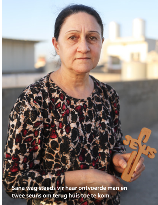
Sana wag steeds vir haar ontvoerde man en twee seuns om terug huis toe te kom.

In 'n land met geen noemenswaardige geestesgesondheidstelsel om die kwessies aan te spreek wat die Christen-gemeenskap vandag ervaar nie, beklemtoon die