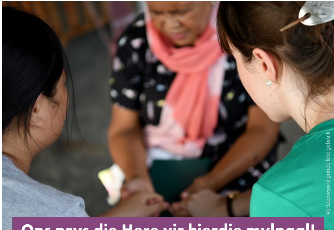
Verteenwoordigende foto gebruik.