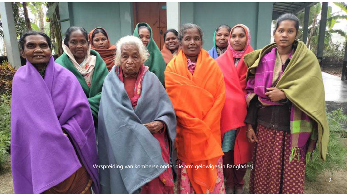
Verspreiding van komberse onder die arm gelowiges in Bangladesj.

Mense droom al vir lank oor verdraagsaamheid, veral op godsdienstige gebied. Ongelukkig is onverdraagsaamheid die