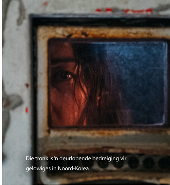
Die tronk is n deurlopende bedreiging vir gelowiges in Noord-Korea.

Shiden het ondenkbare marteling deurgemaak, wat so erg was dat hy in ernstige depressie verval het toe hy uit die tronk vrygelaat is.