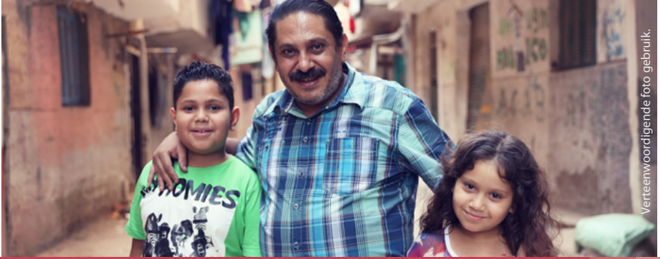
Verteenwoordigende foto gebruik.