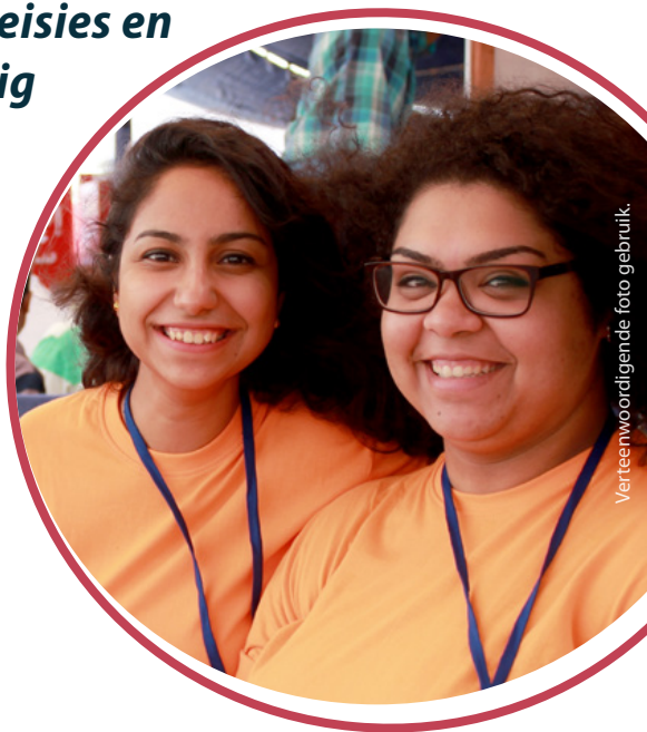
Verteenwoordigende foto gebruik.

Hulle teiken jong Christenmeisies met 'n lae selfbeeld en berei hulle voor deur te maak