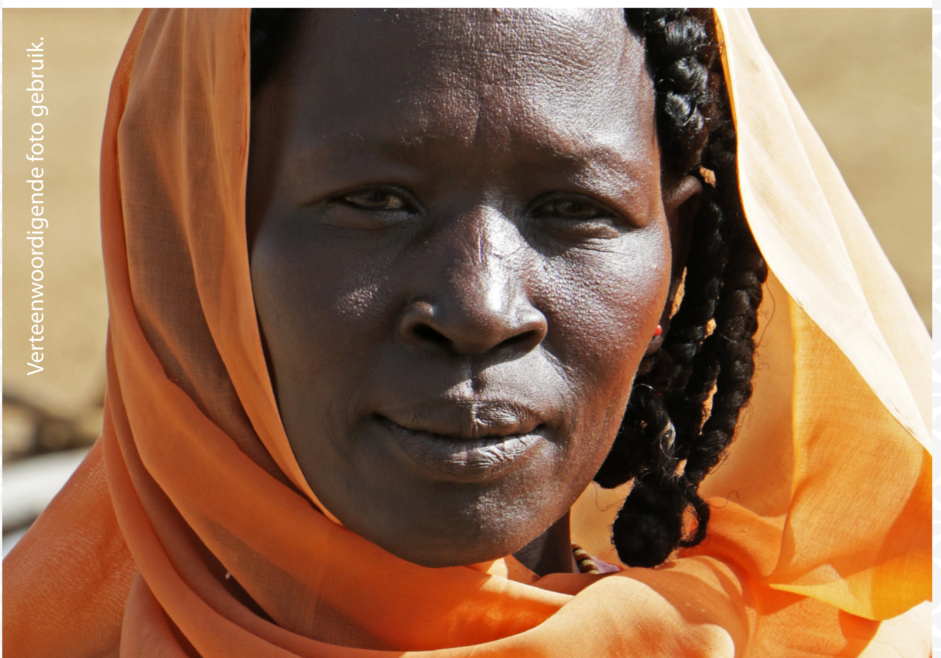
Verteenwoordigende foto gebruik.

5 | EID OEL-FITR Vandag, aan die einde van hul maandlange vas, vier Moslems rondom die wêreld heen Eid. Dit is 'n tyd wanneer Moslems na mekaar se vergifnis soek. Bid dat God hulle oë sal oopmaak om te sien dat Jesus Christus die weg na ewige vergifnis is.