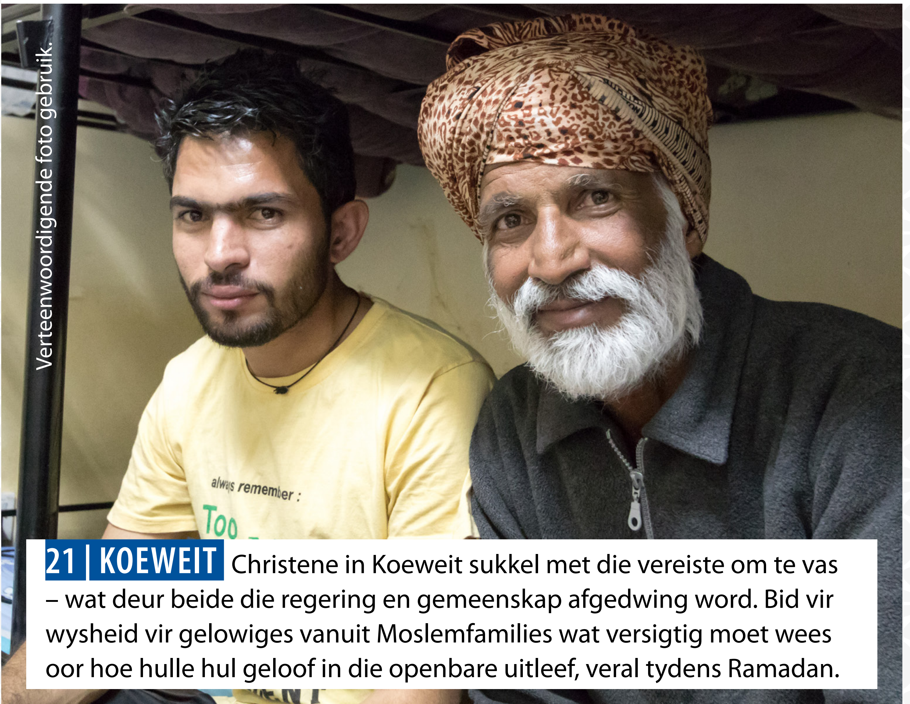
Verteenwoordigende foto gebruik.

20 | VERENIGDE ARABIESE EMIRATE Christene in die Verenigde Arabiese Emirate moet volgens die Islamitiese wette van die land leef. Dit sluit in om nie tydens Ramadan in die publiek te eet of te drink nie. Bid vir meer aanvaarding in hierdie land sodat Christene toegelaat sal word om hul geloof vrylik te beoefen.