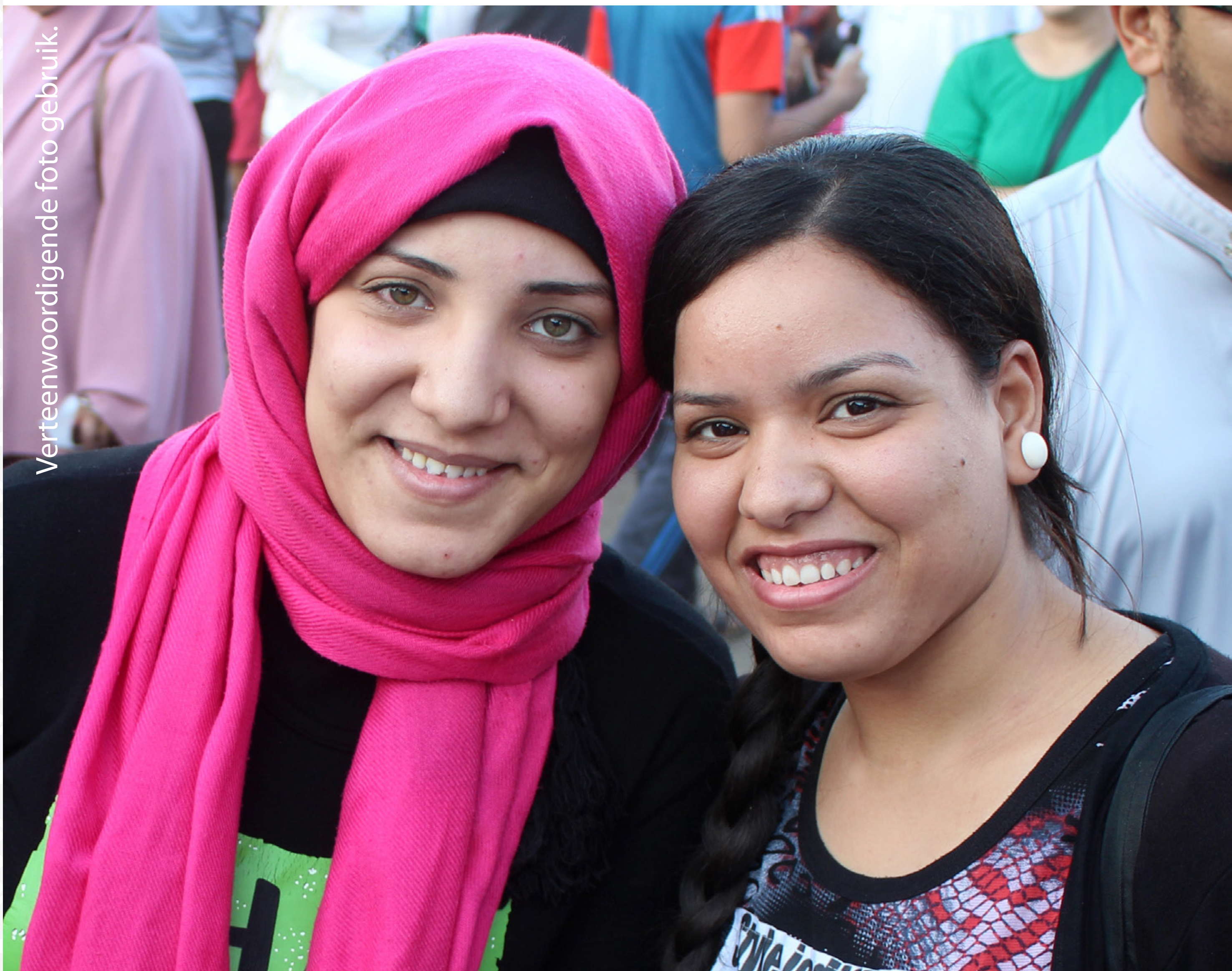
Verteenwoordigende foto gebruik.

Om Moslems waarlik met die Evangelie te bereik, moet ons eerstens verstaan wie hulle is en wat hulle navolg.