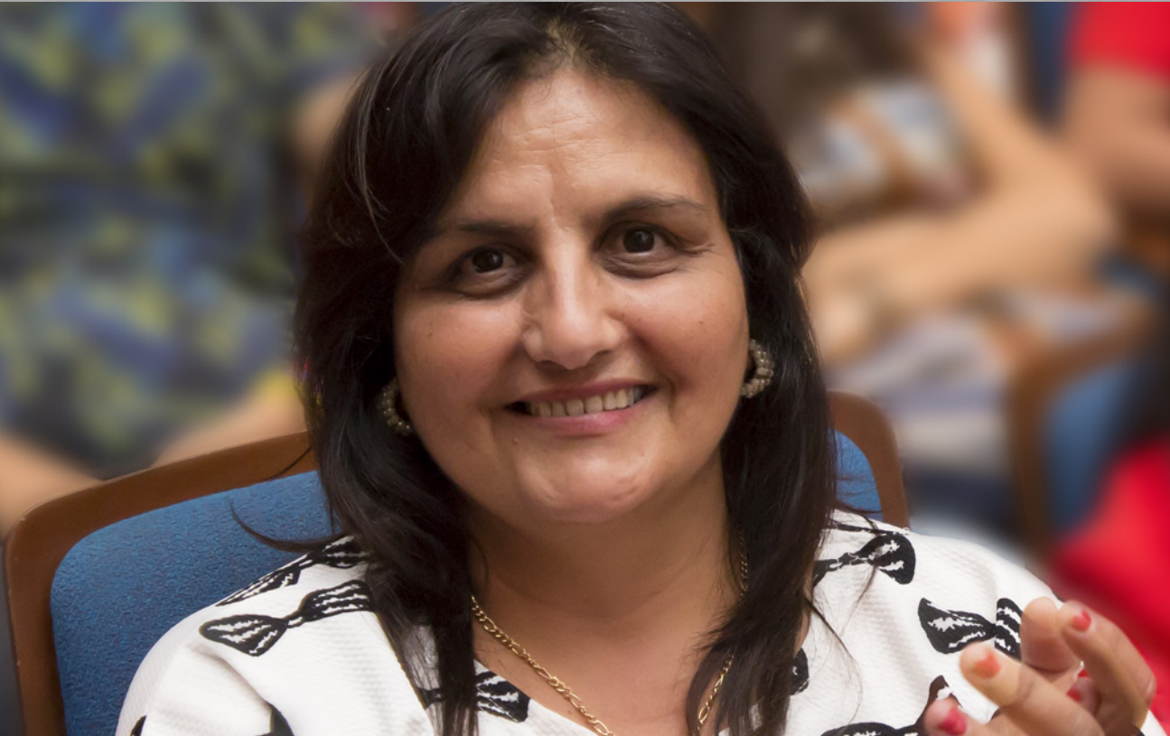
Verteenwoordigende foto gebruik.